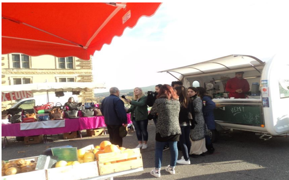
radio trottoir, élèves de 1ere Sapat