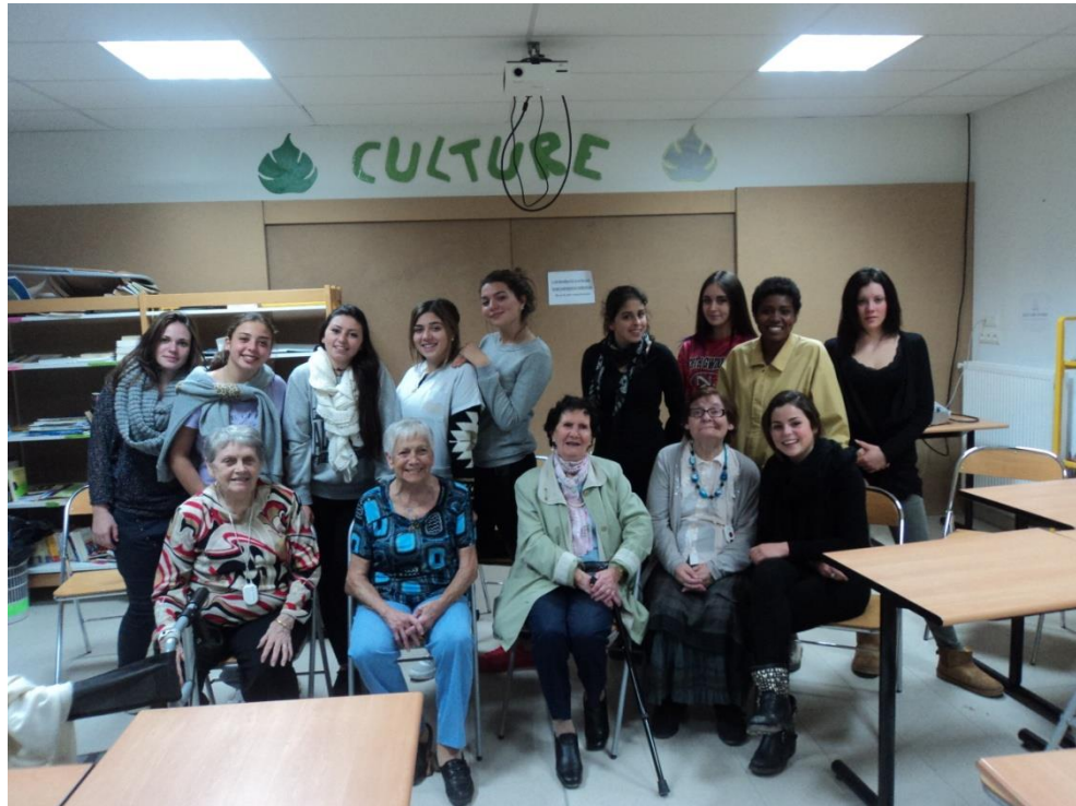
Atelier intergénérationnel « raconte moi ton école » avec les Capa SMR