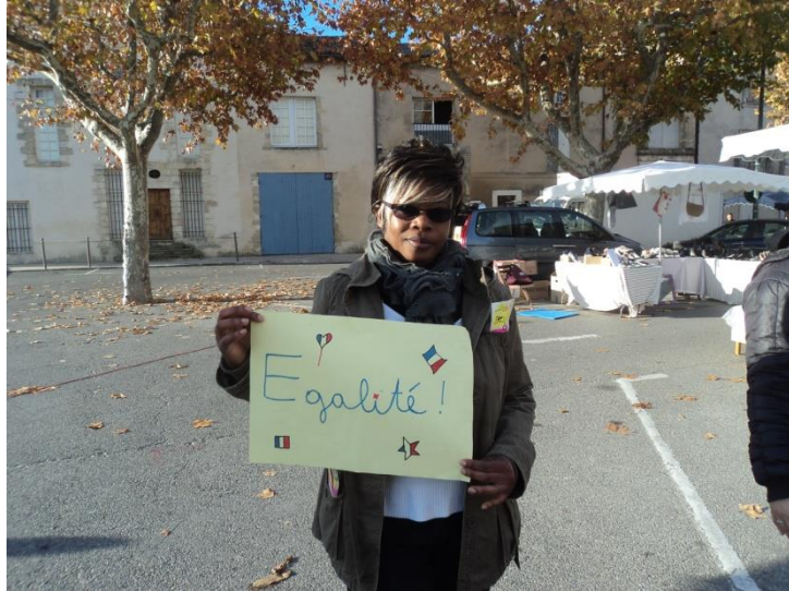
La parole aux citoyens de la Tour d'Aigues