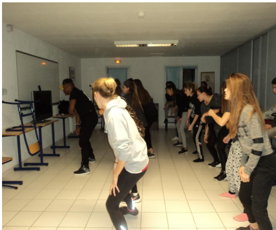
Danse du monde avec les élèves internes